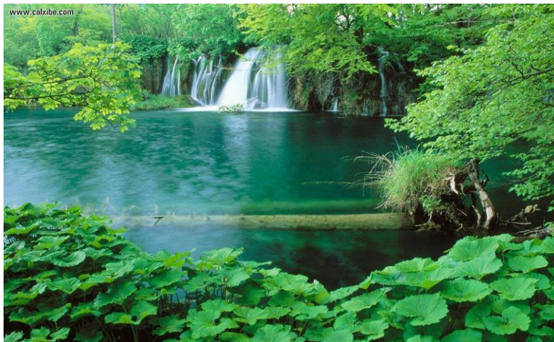
De juiste hartsgesteldheid

Het: "Wierook-altaar" in het N.T. als plaats van geheiligde expressie en bewegen in het witte fijn linnen uit Openbaringen 19: 8 naar onze God de: "Heer der heren"