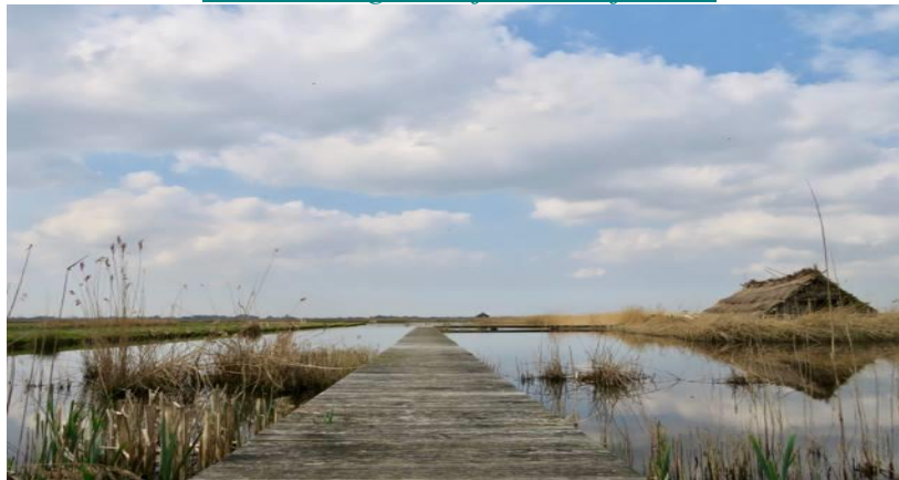
De afronding van Co Werkers Stap 3 → Stap 3 c - 2