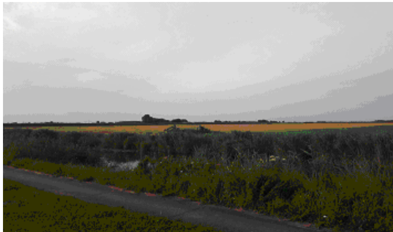
Iets mbt Jezus in b.v. Johannes bv Johannes 1: 1-12